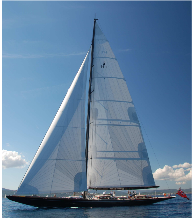
Abb. 5 Lionheart , 2010

Svea geht zurück auf den Entwurf des Schweden Tore Holm von 1937. Viele Fachleute schätzen den seinerzeitigen Entwurf, der die größte Rumpflänge der Js aufwies, als am Wind sehr schnell ein, und Computersimulationen von André Hoek, der die Neuplanung übernommen hat, haben das bestätigt. Aufgrund ihrer sehr flachen Aufbauten ohne große Deckshäuser wird die Svea ein äußerst elegantes Aussehen haben und weniger als Fahrtenyacht, denn als Rennyacht mit spartanischem Innenausbau ausgelegt werden. Der Stapellauf ist ebenfalls für 2012 vorgesehen.