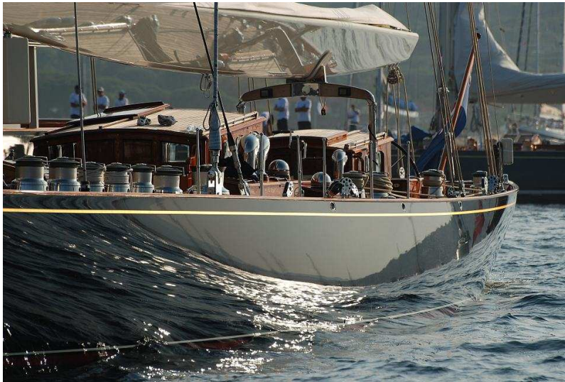
Abb. 3 Velsheda , 2009

1933 lief im englischen Gosport die Velsheda für einen amerikanischen Geschäftsmann vom Stapel, der die Yacht allerdings nie beim AC einsetzte, sie aber siegreich in gut 40 Regatten und – außerhalb des AC – auch gegen andere J-Class-Boote segelte, ehe sich ihre Spur verlor. 1984 wurde der fast verrottete Rumpf in der Flussmündung des Humble in Großbritannien gefunden und gehoben. Das Boot teilte damit ein Schicksal, wie es vielen alten Yachten widerfuhr und in den letzten Jahrzehnten zu einer Art Flussbett-Tourismus führe. Dutzende alter Bootsrümpfe, die längst in Vergessenheit geraten waren, sich durch Matsch und Schlick aber wie dauerkonserviert erhalten hatten und noch brauchbar und wertvoll erschienen, wurden seither in moderigen Flussläufen aufgespürt und restauriert.