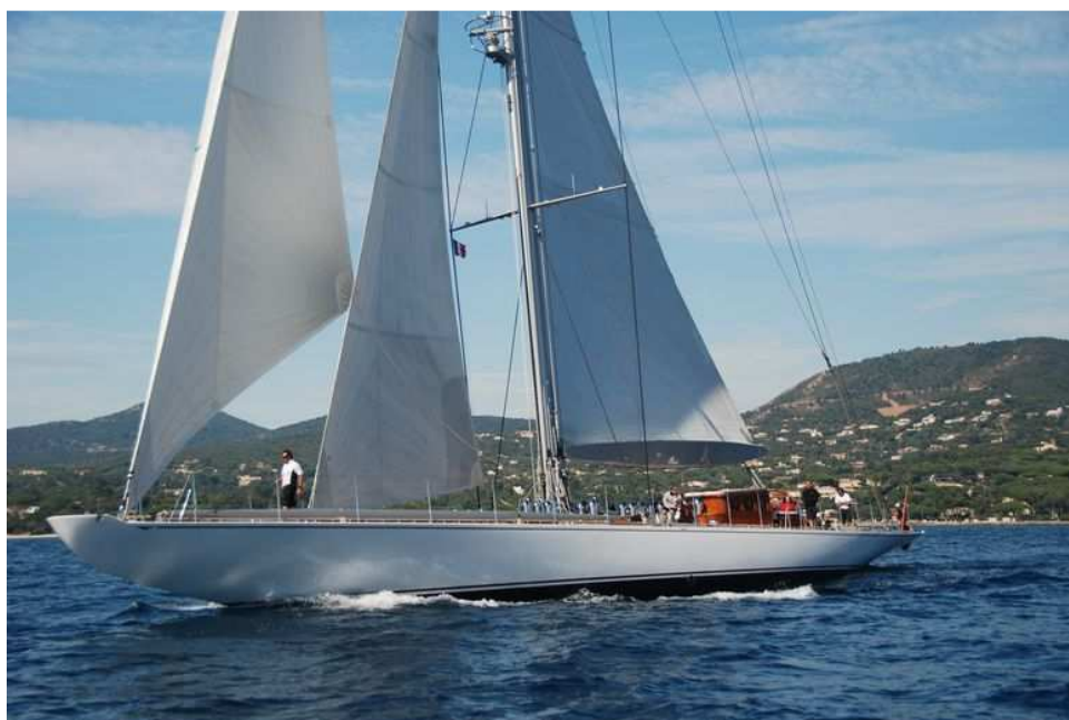
Abb. 4 Ranger , 2010

Hanuman ist der zweite Neubau einer J-Class-Yacht und wurde 2009 von Royal-Huisman in den Niederlanden abgeliefert. Das Boot ist ein Nachbau der Endeavour II von 1936. Gerard Dykstra, der auch weitere J-Class-Boote in der Planung hat, war für die Gesamtkonzeption ver-