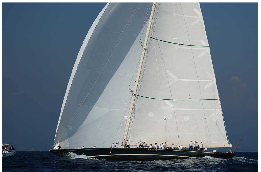
Abb. 2 Shamrock V , 2009.

1930 wurden fünf Js abgeliefert, zunächst für Lipton die Shamrock V . Er hatte bis dahin schon viermal erfolglos ein Cup-Duell gegen die Amerikaner hinter sich. Als Reaktion auf Liptons erneute Herausforderung baute man in den USA die Boote Weeta-moe , Yankee , Whirlwind und Enterprise , von denen sich letztere in Testfahrten als Verteidigeryacht durchsetzte, die anderen nutzte man als Trainingsyachten. Yankee segelte übrigens als einzige amerikanische J, wenn auch außerhalb des AC, in europäischen Gewäs-