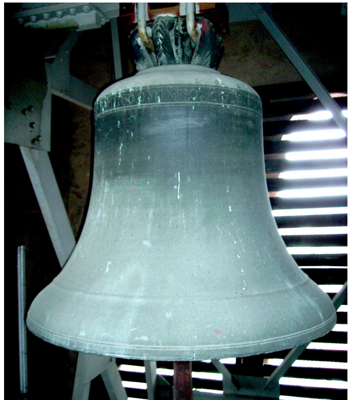
Würzburger Domgeläut, Lobdeburg -Glocke.

Freilich könnten dies beiden Ausnahmeglocken auch jetzt noch durch eine – allerdings nicht vollgeläutefähige – h-Glocke ergänzt werden. Sei es h 0 , h 1 oder h 2 , oder zwei oder alle drei von ihnen. Im Zweifelsfall und bei Raumproblemen ist immer noch an die zwei leeren Osttürme zu denken.