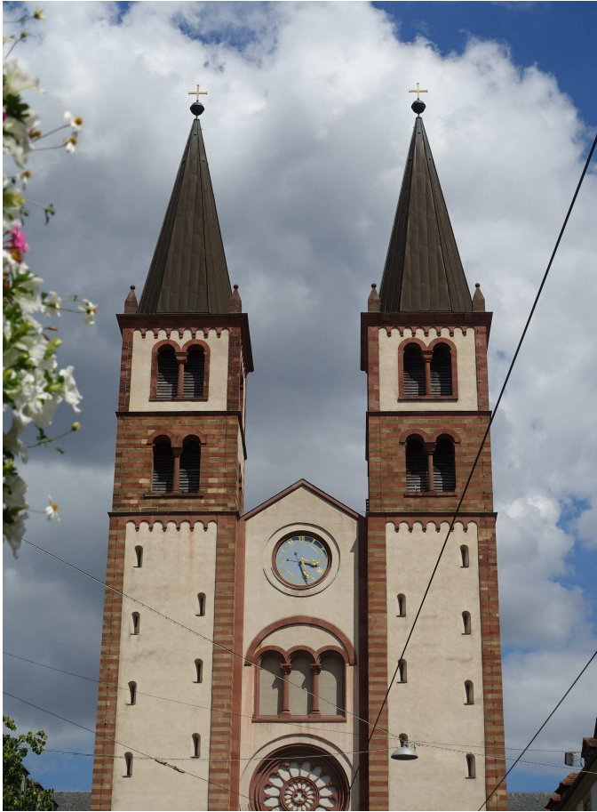
Dom Würzburg, Westfassade

der Unteroktave vom „Unterton“. Die Benennungen bezeichnen also nicht unbedingt den physikalisch korrekten Intervall-Abstand, sondern das als Konvention festgelegte Intervall. Dabei liegt allerdings regelmäßig der Nenn-ton (Schlagton) genau 12 Halbtöne unterhalb des Oktavteiltons.