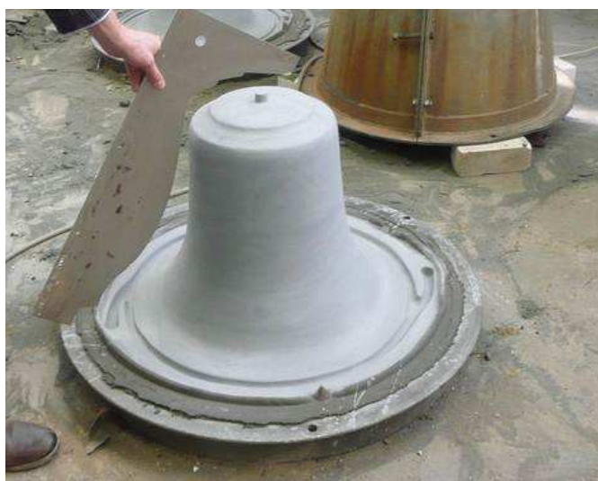
Vorbereiter Glockenkern und Schablone für den Glockenmantel. Fa. Eijsbouts, Asten, Niederlande.

Übrig bleiben eine äußere und eine innere Schale, die den Hohlraum in genau der späteren Glockenform umschließen.