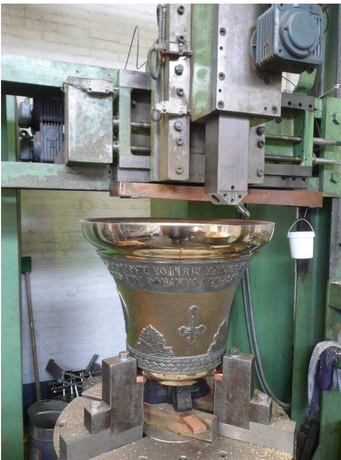
In einer riesigen Drehbank der Glockengießerei Eijsbouts in Asten (NL) werden Glocken nachgestimmt.

Nicht selten schaut eine Abordnung der Kirchengemeinde dem gleichermaßen spannenden wie feierlichen Augenblick des Gießens – nach vorhergehendem Segen – zu.