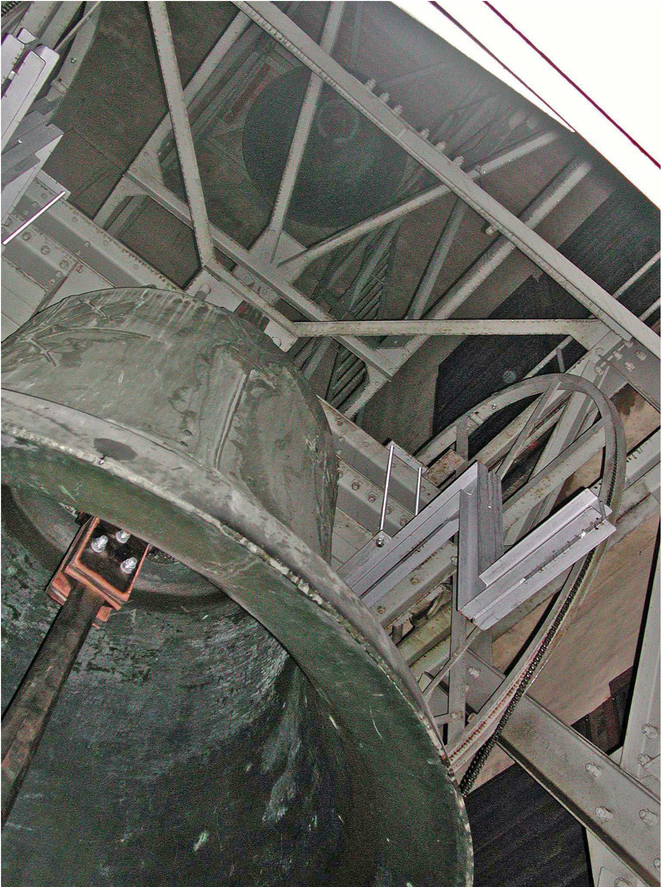
Christus-Salvator-Glocke und (ganz oben) Lobdeburg-Glocke im Südwestturm des Würzburger Domes (Zustand 2001 und vor Einbau des Zimbelgeläutes). Man achte auf die Kröpfung der Salvatorglocke in Kronenhöhe, erfolgt zur Verkleinerung des Schwungrums.

Foto Prof. Dr. R. Pfeiffer-Rupp, 25.12.2001