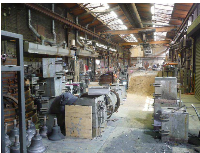
Blick in die Werkhalle der Glockengießerei Eijsbouts in Asten, Niederlande.